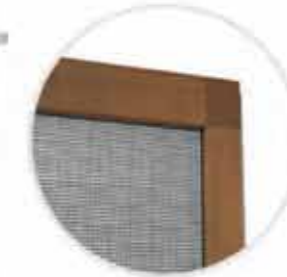
Ramka z narożnikiem zewnętrznym w wersji z bocznym doszczelnieniem