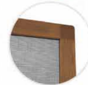
Ramka z narożnikiem zewnętrznym tworzywowym