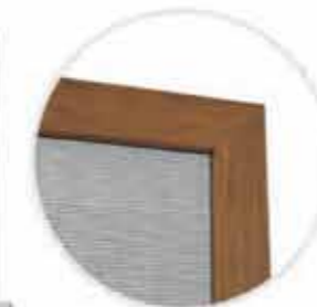
Ramka z narożnikiem wewnętrznym