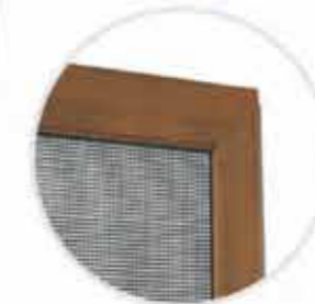
Ramka z narożnikiem wewnętrznym w wersji z bocznym doszczelnieniem